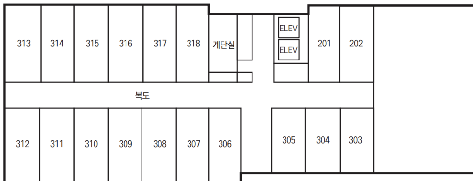
3층 장애인시설 설치계획도 (여자생활관)