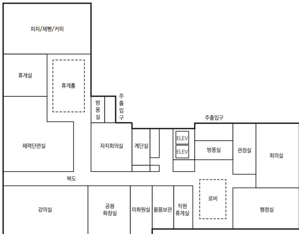
1층 장애인시설 설치계획도 (여자생활관)